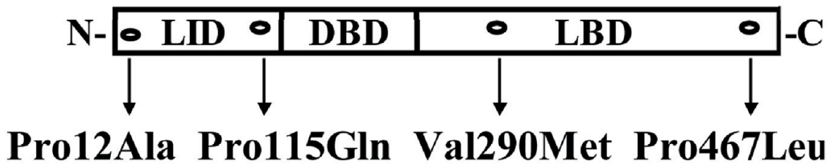
Ryc. 1. Polimorfizm PPAR- \gamma

wyższe osoby charakteryzują się mniejszym ryzykiem choroby wieńcowej niezależnie od otyłości, mniejszym stężeniem apoB w surowicy krwi, a ponadto korzystnym stosunkiem cholesterolu całkowitego do cholesterolu HDL [35]. Takiej zależności nie obserwuje się w populacji osób chorych na cukrzycę [7]. Może to wynikać z przewagi niekorzystnych zaburzeń metabolicznych u tych pacjentów nad ochronnym działaniem zmutowanego allelu. Warto zauważyć jednak, iż genotyp dziki C161C wiąże się z mniejszym ryzykiem zachorowania na cukrzycę typu 2, jeżeli współistnieje z polimorfizmem genu UCP2 (uncoupling protein 2) – Ala55Val [9].