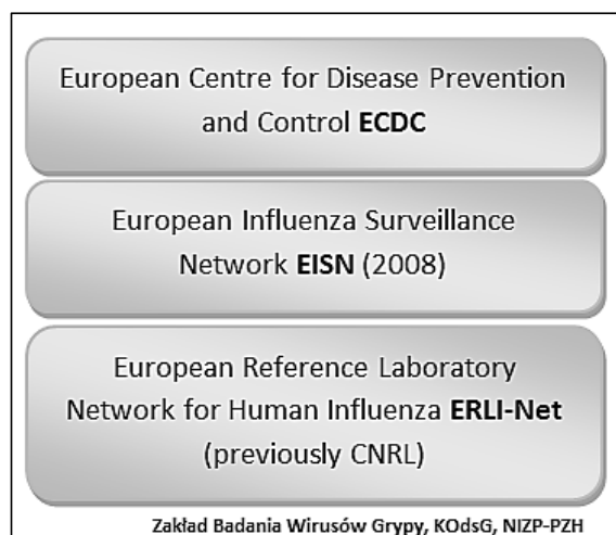
Ryc. 2. Schemat Europejskiej Sieci Nadzoru nad Grypą